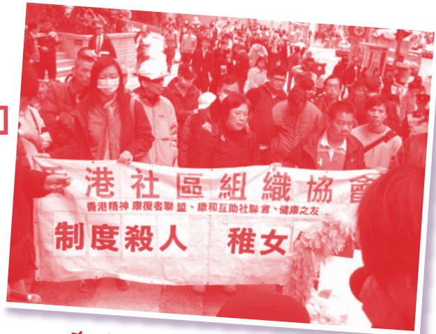
在政府總部西翼門外請願

你們還記得在近月有一宗慘劇案呢？患躁狂抑鬱症的精神病婦，疑因13個月大養女的哭啼聲影響病婦情緒，至失控把女嬰「倒豎蔥」頭部多次擲地，女嬰終重傷不治。原來病婦早於病發前約2個月約見醫管局精神科，獲安排於3個月後才接受診治，終在等候期間發病，釀成慘案。(資料由明報提供)報紙標題： 關注精神病組織 轟「制度殺人」