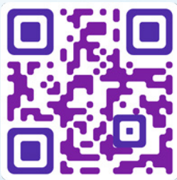
精聆計劃的臉書專頁